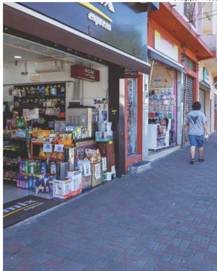
Comércio pode ficar aberto até às 22 horas