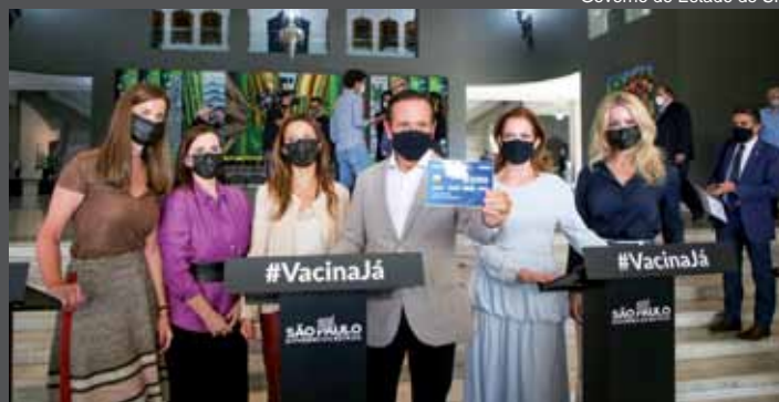
Doria: cartão será usado na compra direta nos supermercados

A distribuição dos cartões acontecerá por meio do Fundo Social do Estado de São Paulo,