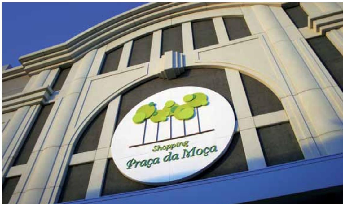
Shopping Praça da Moça unificou as campanhas do Dia das Mães e dos Namorados