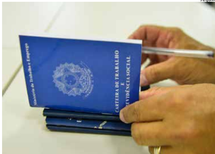
Comércio apresenta saldo negativo de 24.626

Entre os estados, o que mais contratou proporcionalmente em fevereiro foi Mato Grosso, com um saldo de 23,26 por mil empregados. Amazonas tem o pior desempenho e foi o único estado com saldo negativo, tanto em números absolutos, com 868 demissões, quanto proporcionalmente, com saldo negativo de 5,65 por mil empregados. Em números absolutos, São Paulo foi o estado com melhor saldo de emprego, 73,7 mil empregos gerados. (Agência Brasil)