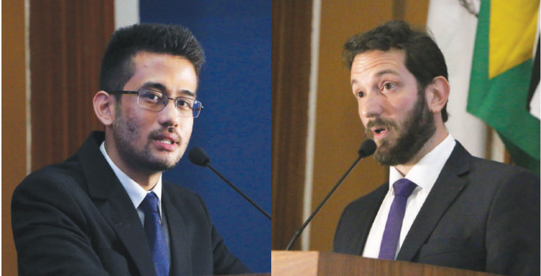
Kataguiri e Braidão: “quando Lula diz que foi um golpe de estado, fere todas as instituições”

Os políticos destacam que o impeachment foi um processo democrático, com apoio popular, e seguiu todos os ritos constitucionalmente previstos, com direito a contestações por parte da base de sustenta-