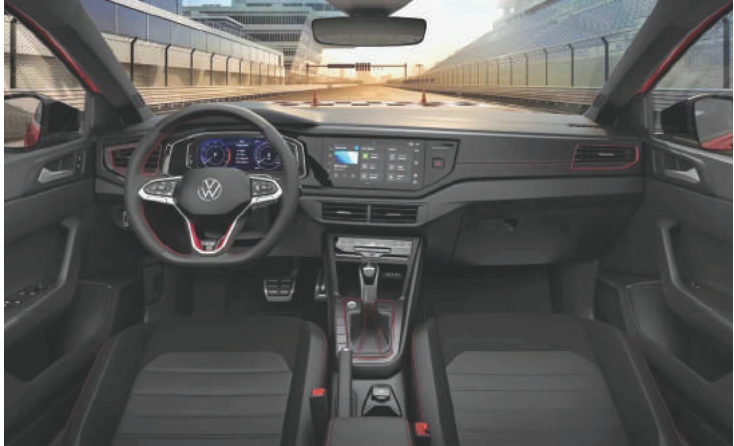
Cabine com acabamentos em preto transmite esportividade