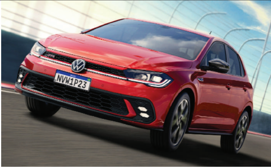
Na versão GTS do Polo, dianteira está mais encorpada e agressiva, enquanto a traseira traz novo para-choque, com difusor imponente, e ponteira dupla de escape

A família Polo é composta ainda pela porta de entrada Track, lançada no final do ano passado (R$ 79.990), e pelas versões MPI (R$ 83.990), 170 TSI (R$ 93.990), Comfortline, (R$ 102.990) e Highline (R$ 111.990). A ampliação da diversidade de versões pode ajudar as vendas do hatch compacto, apontado pela própria VW como o sucessor do agora aposentado Gol. No ano passado, a família Polo teve 8.193 emplacamentos no país, que lhe renderam a