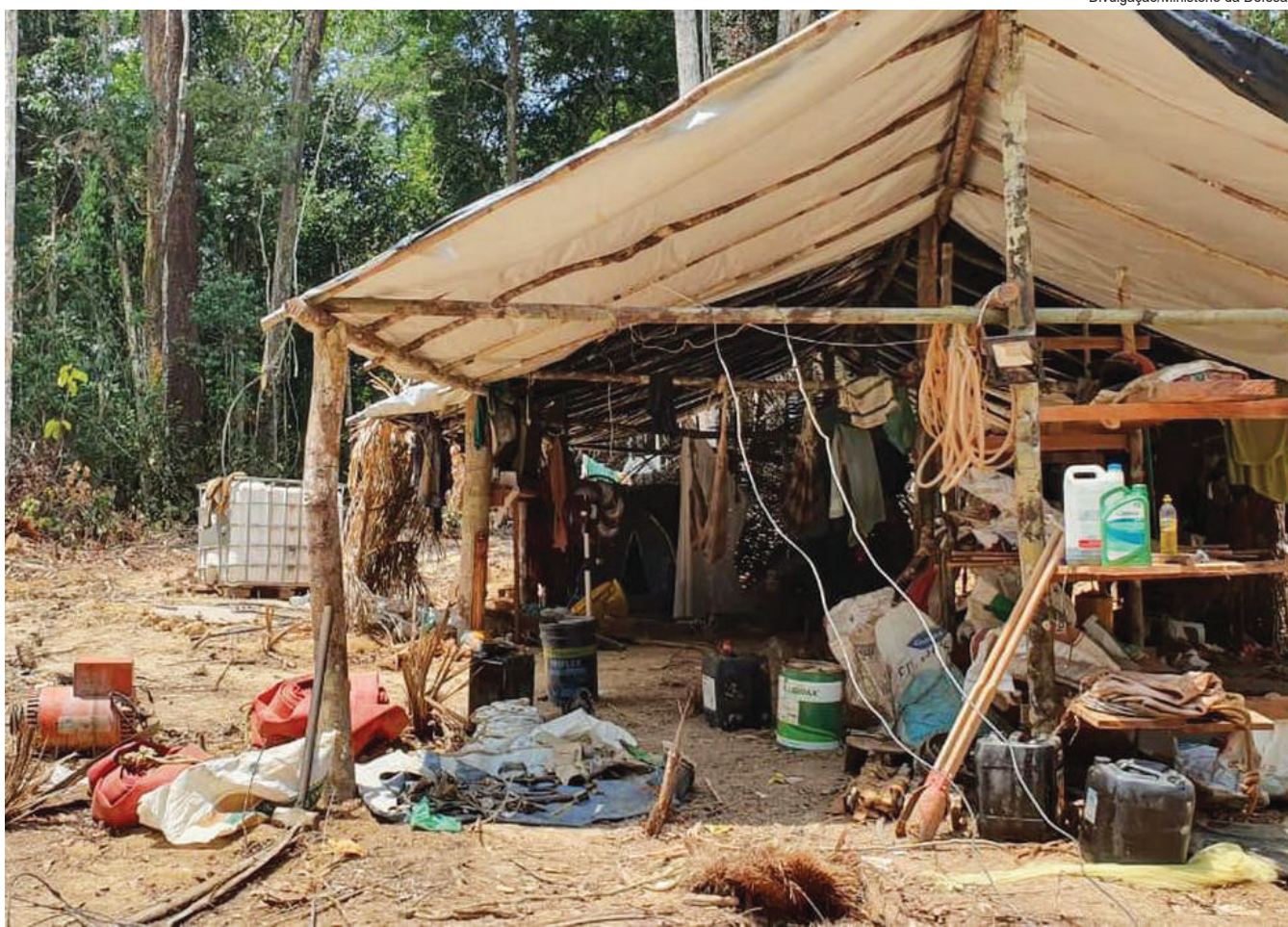
Em dezembro de 2022, último mês do governo de Jair Bolsonaro, a área devastada era de 5.053,82 hectares

Santo André e São Bernardo integram o ranking dos 20 municípios com mais regiões em risco no Estado de São Paulo O ABC tem 165.554 pessoas que vivem em 86 áreas de risco, das quais nove são classificadas como de “risco muito alto” para deslizamentos e inundações, por exemplo. Os dados constam do painel do Serviço Geológico do Brasil ( dados atualizados em 09/01/23 ), vinculado ao Ministério de Minas e Energia. Santo André e São Bernardo constam no ranking dos 20 municípios do Estado de São Paulo com grande quantidade de áreas de alto e muito alto risco, respectivamente, em terceiro e quarto lugares. Em Diadema há duas áreas consideradas de alto risco e, em Mauá, uma de risco muito alto para deslizamentos. Ribeirão Pires e Rio Grande da Serra têm cada uma duas regiões consideradas de alto risco para deslizamentos. Santo André tem 40 áreas de risco, São Bernardo, 37 e São Caetano, duas. São Paulo está entre os estados mais impactados por áreas em risco, juntamente com Santa Catarina, Minas Gerais e Espírito Santo. No Estado há 842 regiões problemáticas, sendo 157 de risco muito alto e as demais de alto risco. Nessas regiões há 496.078 paulistas vivendo em situação de risco. Já em nível nacional há 3,9 milhões de pessoas que vivem em 13.297 áreas sujeitas a deslizamentos, erosão, inundação, entre outros. Página 5